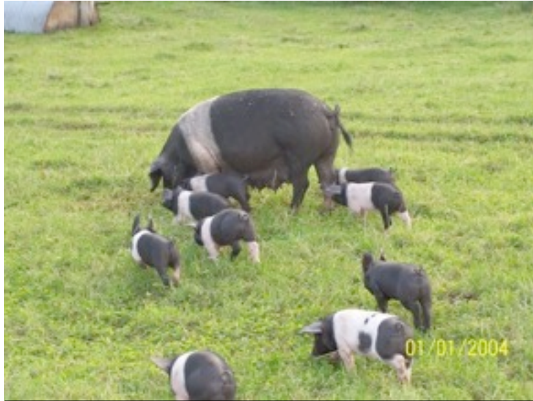
Muttersau mit Ferkeln (Abb. 1)