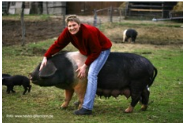
Reitversuch (Abb. 2)

Das Angler Sattelschwein verdankt seinen Namen also nicht dem Umstand, dass der Bauer es früher sattelte, um auf ihm zur Stadt zu reiten. Dazu hatte er elegante oder auch kräftig gebaute Pferde wie das Schleswiger Kaltblut. Reitversuche hat es aber gegeben wie das folgende Bild zeigt: